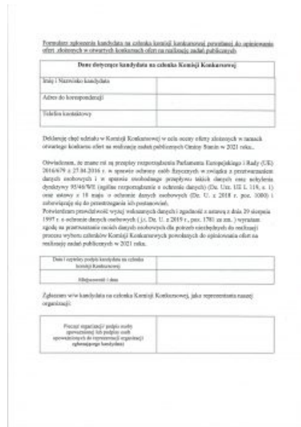
Formularz zgłoszenia kandydata na członka komisji konkursowej