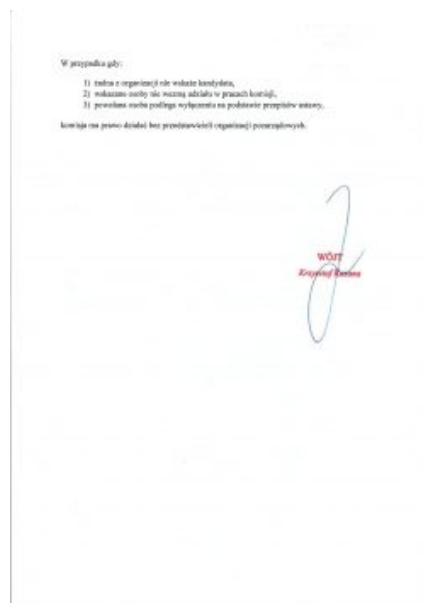
Ogłoszenie Wójta Gminy Stanin 2/2